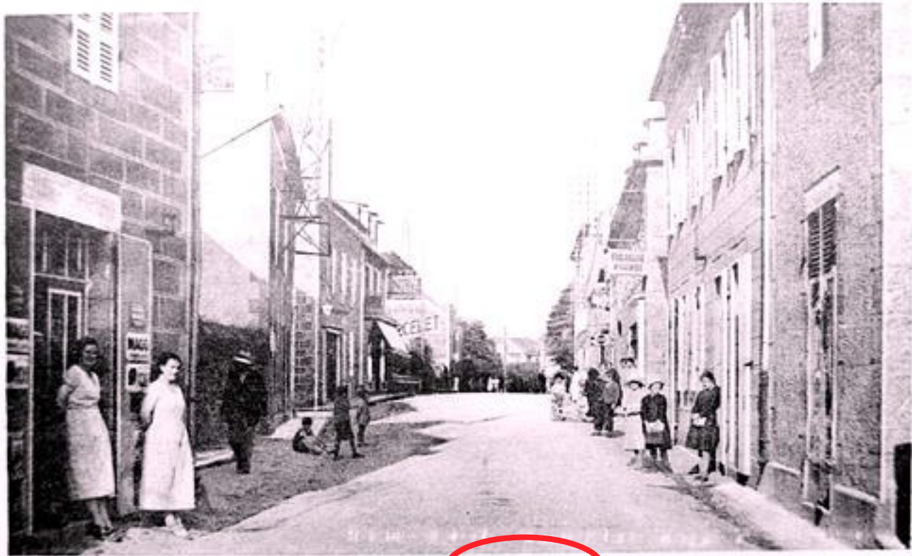
LANNILIS Rue de la Mairie